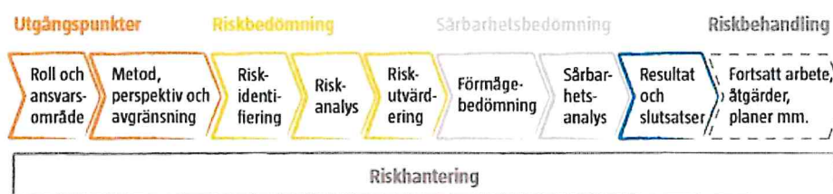
Figur 3 Schematisk bild av riskhanteringsprocessen

Dessa steg i riskhanteringsprocessen pågår aldrig var för sig utan de är beroende av varandra och löper parallellt.